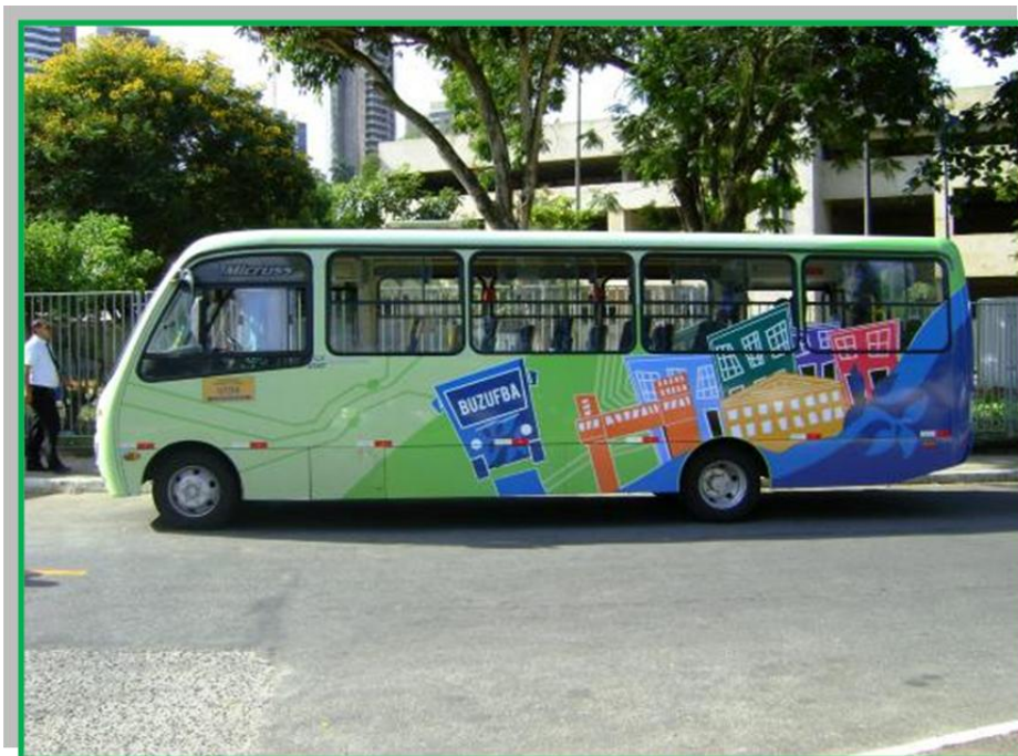
BUZUFBA atende a todos os alunos da UFBA

O BUZUFBA, sistema de transporte intercampi gratuito, composto por quatro microônibus contratados, com capacidade para 27 passageiros sentados e 13 em pé, começou a operar no início das aulas do segundo semestre de 2012 da Universidade Federal da Bahia. Todos os veículos possuem acessibilidade para usuários de cadeiras de rodas.