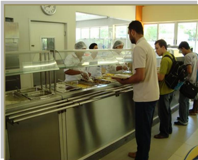
Estudantes almoçam no R.U da UFBA