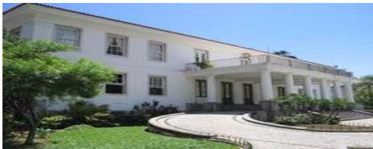
Reitoria da UFBA